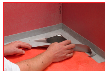
4. Montering av Seal-Strip.