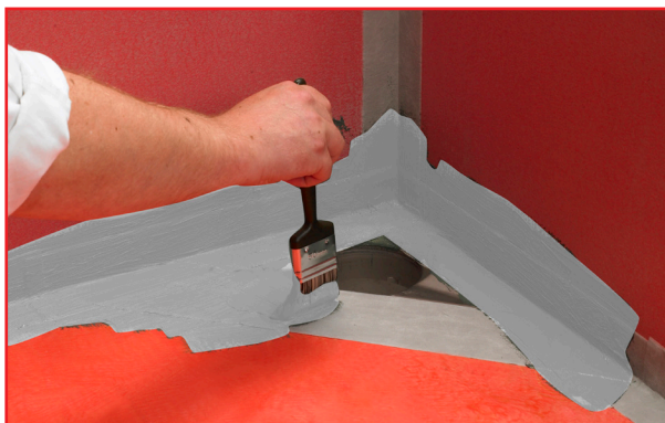
5. Påföring av Alfix Tätningsmassa.

Åtgång: 1,5 kg Alfix 1K Tätningsmassa per m 2 .