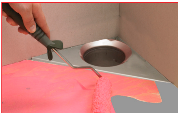
2. Primning av underlag.

Med flat, styv pensel eller med roller påføres alla ytor Alfix Primer Vattenspärr i minimum 2 appliceringar. I första appliceringen förtunnad med vatten i förhållande 1:3 och outspädd till full täckning i den efterföljande applicering. Torktid mellan strykningarna: Ca: 1 timme vid 20°C. Åtgång: Ca: 0,200 ltr (motsvarande ca. 240 g) Primer Vattenspärr per m 2 .